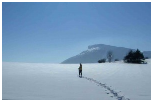
Le plateau de Corréo, devant notre gîte !

Nous sommes à l'Ouest de Gap dans les Hautes-Alpes, dans la vallée du petit Buëch, là où la rivière quitte les gorges qu'elle a creusée.