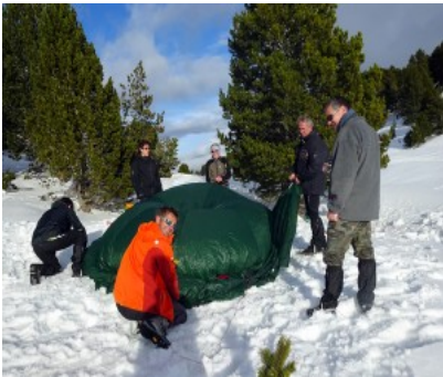
Installation du camp