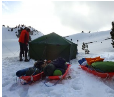
Tout est prêt, nous partons faire un tour