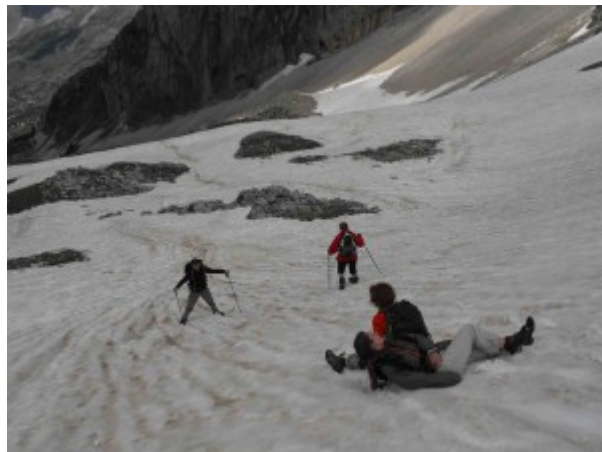
Dernières glissades sur derniers névés ! youhouuuu !