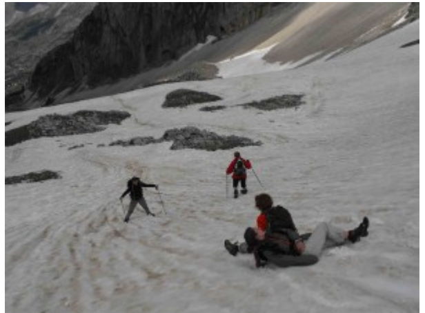
Dernières glissades sur derniers névés ! youhouuuu !