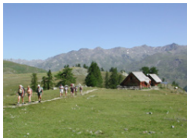
Nos refuges au coeur des alpages

C'est un séjour très diversifié par les paysages traversés ; 7 itinéraires avec des parcours en fond de vallée, en balcon de vallée, en balcons d'éboulis, en alpages. Des étapes dans des refuges aux dortoirs de 4 à 8, et des repas fait maison par les gardiens très attentionnés. Les linges de rechange et de nuit seront transportés dans nos sacs à dos.