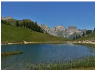
Le reflet des arêtes dans la douceur des lacs