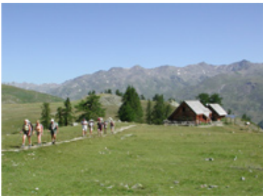
Nos refuges au coeur des alpages

C'est un séjour très diversifié par les paysages traversés ; 7 itinéraires avec des parcours en fond de vallée, en balcon de vallée, en balcons d'éboulis, en alpages. Des étapes dans des refuges aux dortoirs de 4 à 8, et des repas fait maison par les gardiens très attentionnés. Les linges de rechange et de nuit seront transportés dans nos sacs à dos.