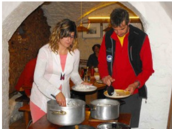
Notre super chef intendant-cuisinier, à gauche !

– Ce séjour allie des étapes de découverte en étoile autour du gîte à Prapic, puis 2 traversées plus physiques, pour rejoindre la vallée de Dormillouse. C'est une belle mixité des itinéraires.