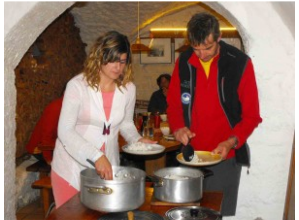
Notre super chef intendant-cuisinier, à gauche !

– Ce séjour allie des étapes de découverte en étoile autour du gîte à Prapic, puis 2 traversées plus physiques, pour rejoindre la vallée de Dormillouse. C'est une belle mixité des itinéraires.