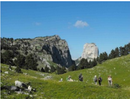
Traversée du Vercors

Rando accompagnée / 4 à 6 jours / 300 à 500€.